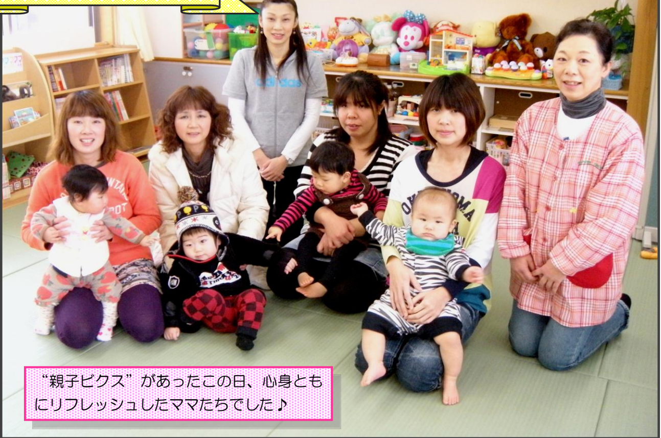
“親子ピクス”があったこの日、心身ともにリフレッシュしたママたちでした♪

「いみず子育て情報 ちやいる.com (どっとこむ)」は、射水市で子育てしているパパ・ママのための子育て情報をお届けしています。情報誌では、射水市民の方がもっと知りたいと思う情報について射水市少子化対策調査研究ワーク会議委員の方々と一緒に調べ、情報を提供していきます。