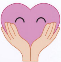
あんしんルームシンボルマーク

♪子育てに関する悩み・不安など、子どもに関わる様々な悩みについての相談（来所・メール・電話）に応じています。