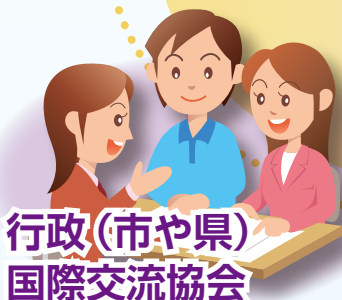
行政(市や県) 国際交流協会