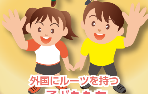
外国にルーツを持つ 子どもたち