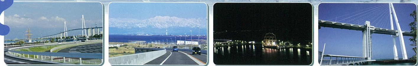
弧を描いて昇って行く先に広がる風景に期待感アップ! 堀岡側へ降りてくると眼下に紺碧の海が広がり空にそびえ立つ雄大な立山連峰が迫ってくる。 橋の上から見える、テーマパークのようなイルミネーションに気持ちが高ぶる! 越の潟側のあいの風プロムナードへのエレベーター。栈橋を渡って新湊大橋の中へ!!