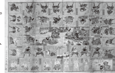
前田土佐守家資料館蔵「甲冑着用備双六」

本展覧会では、教育教材や商品の付録、広告媒体にも利用され、長く親しまれてきた絵すごろくの変遷をご紹介します。