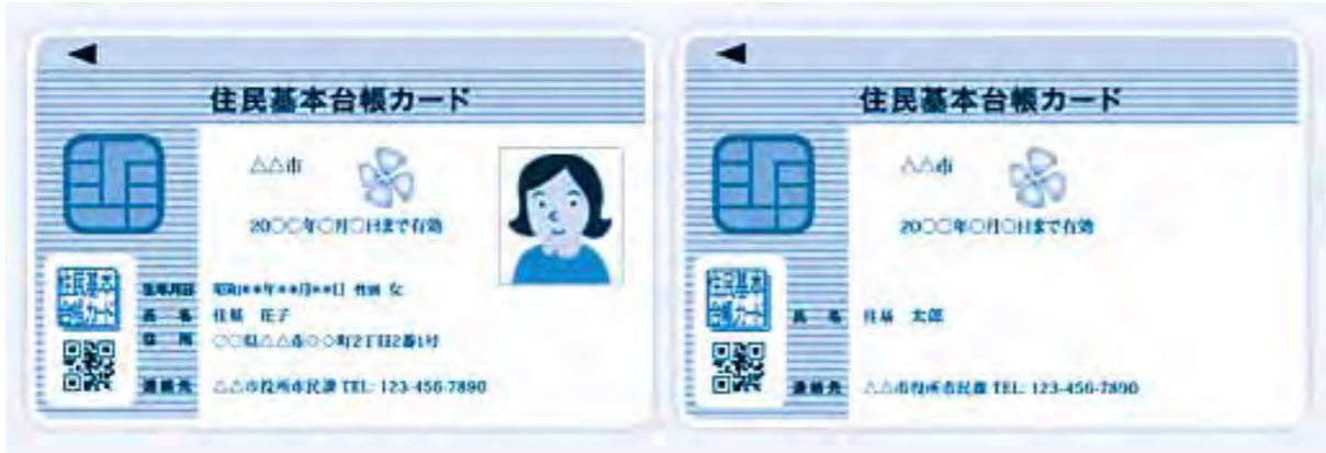
▲住民基本台帳カード 見本