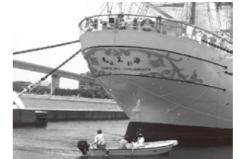
海王丸一周クルーズの様子

13日:カッター教室 14日:小型船「なご」による海王丸一周クルーズ、ミニ展帆 15日:総帆展帆・登しよ礼・満船飾