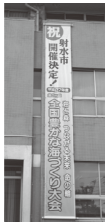
▲射水市役所新湊庁舎前に垂れ幕を設置しました