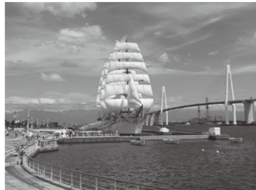
▲放流会場予定地 海王丸パーク

天皇皇后両陛下がご臨席されることが通例となっているこの大会は、水産資源の保護・管理と海や湖沼・河川の環境保全に対する意識の高揚を図るとともに、つくり育てる漁業の推進を通じ、明日の我が国漁業の振興と発展を図ることを目的に、国民的行事として開催されている大会です。射水市では大会の開催に向け、随時大会概要をお知らせする等、市民挙げての歓迎ムードを盛り上げていきます。