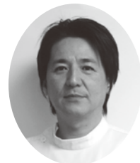
外科部長 (医療安全管理室長)