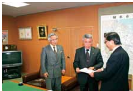
■行財政改革の推進に向けた提言