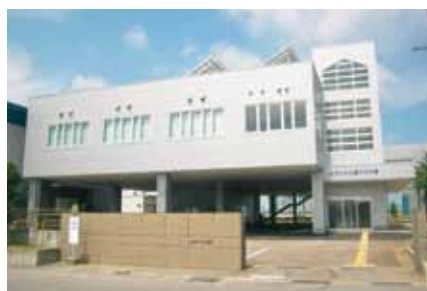
■ミライクル館プラザ棟竣工