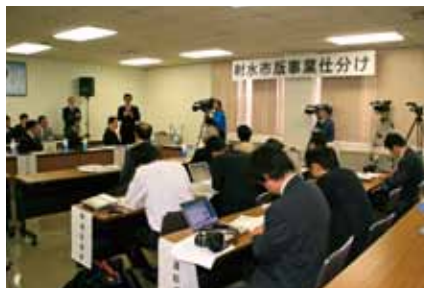
■射水市版事業仕分け