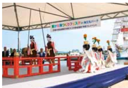
■豊かな海づくりフェスタin海王丸パーク