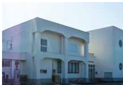
■水戸田コミュニティセンター竣工