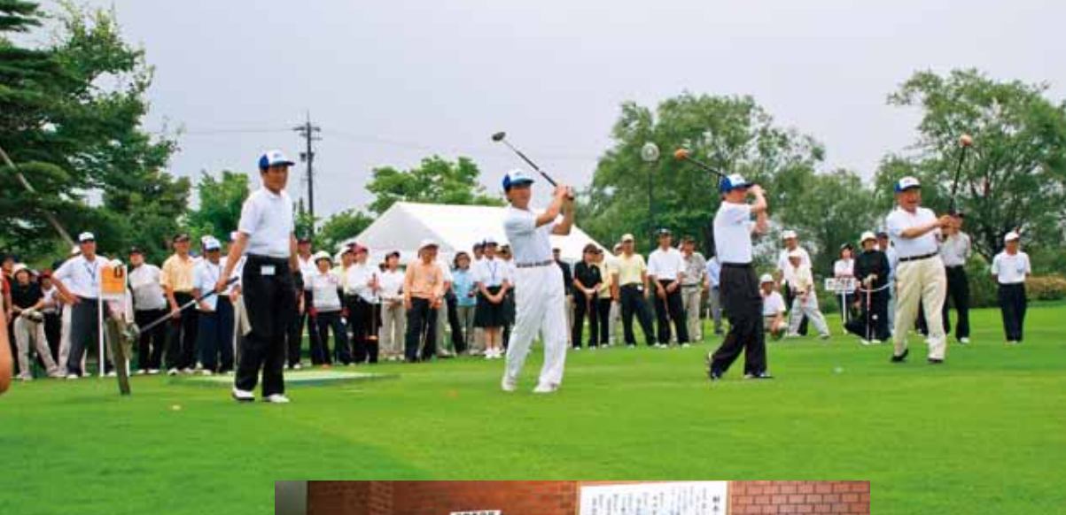
■第1回全国 パークゴルフ 交流大会in射水