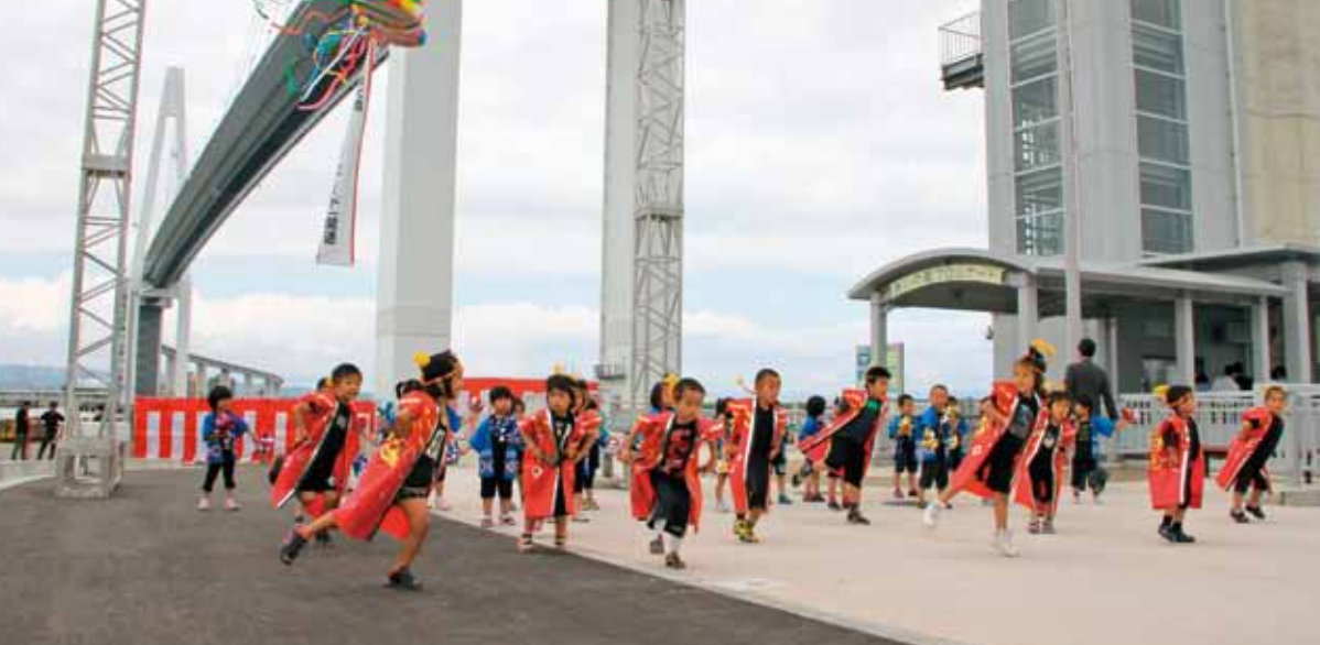
■あいの風プロムナード開通