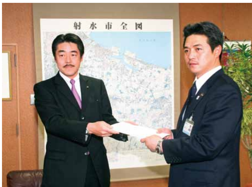
■射水市新庁舎整備の在り方提言