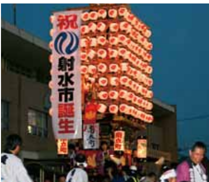
■射水市誕生記念「曳山巡行」