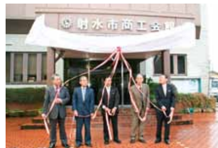
■射水市商工会誕生