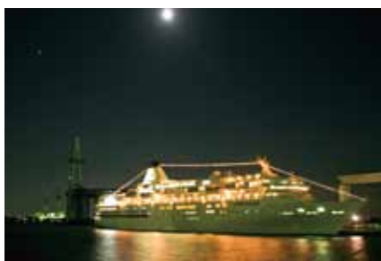
■ぱしふいっくびいなす寄港