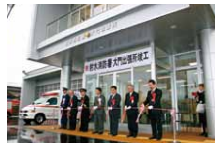
■射水消防署大門出張所竣工