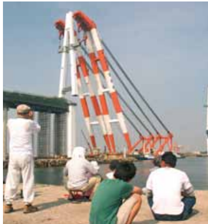
■新湊大橋主塔上部設置