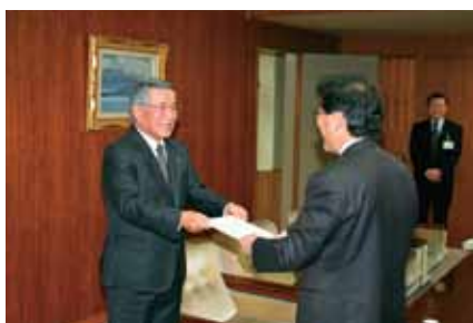
■「射水ブランド基本計画」答申