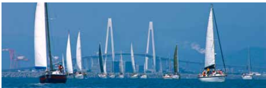
■「タモリカップ富山大会」が日本海側初開催