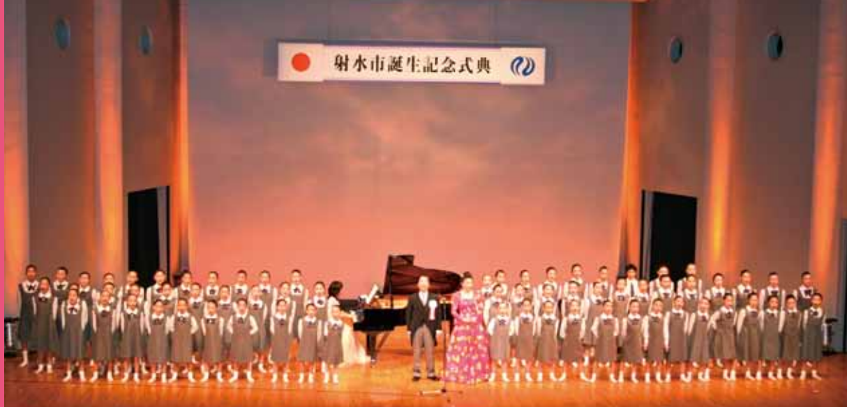
■射水市誕生記念式典