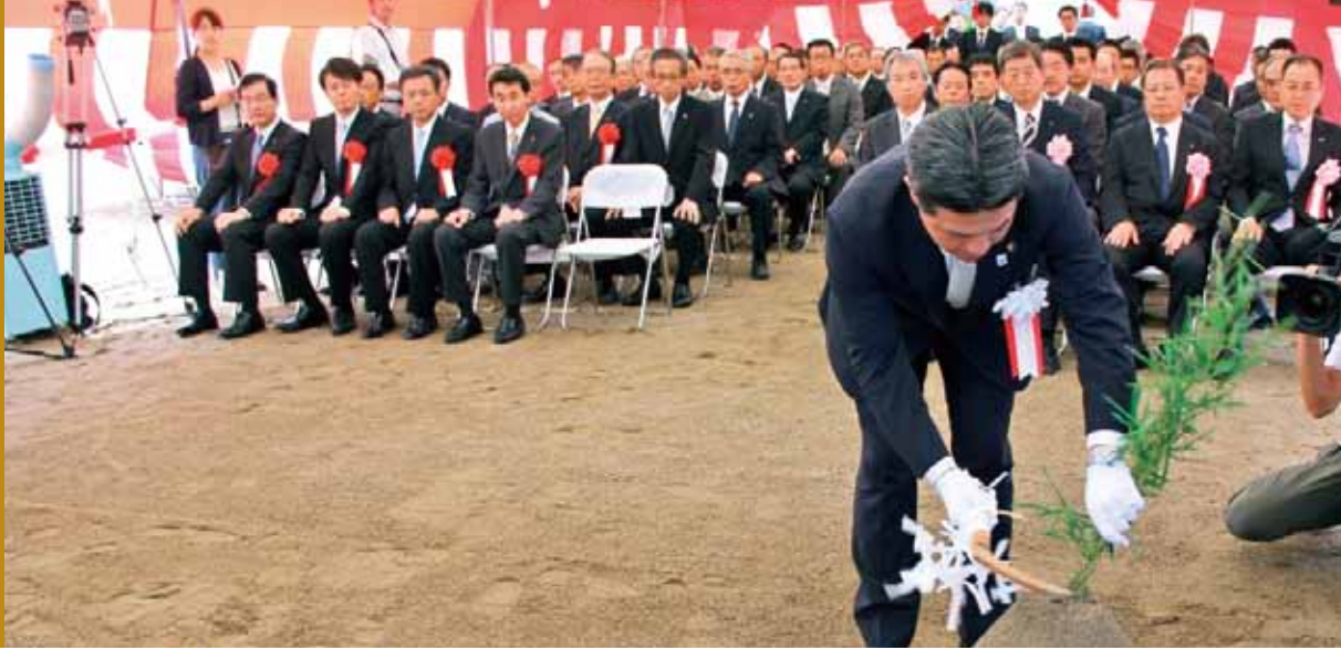
■射水市庁舎新築工事起工式