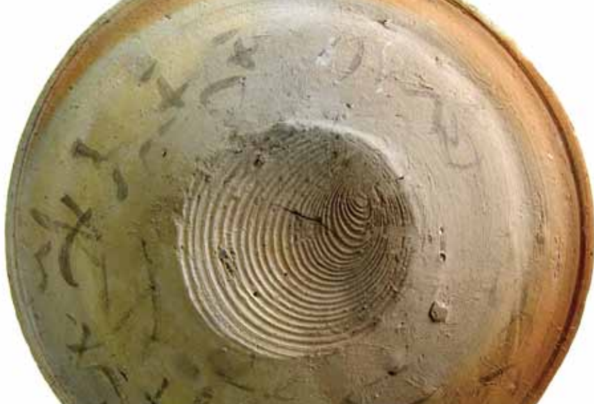
■草仮名墨書土器発見