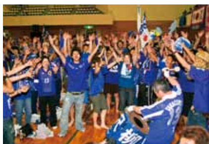
■サッカーワールドカップドイツ大会パブリックビューイング