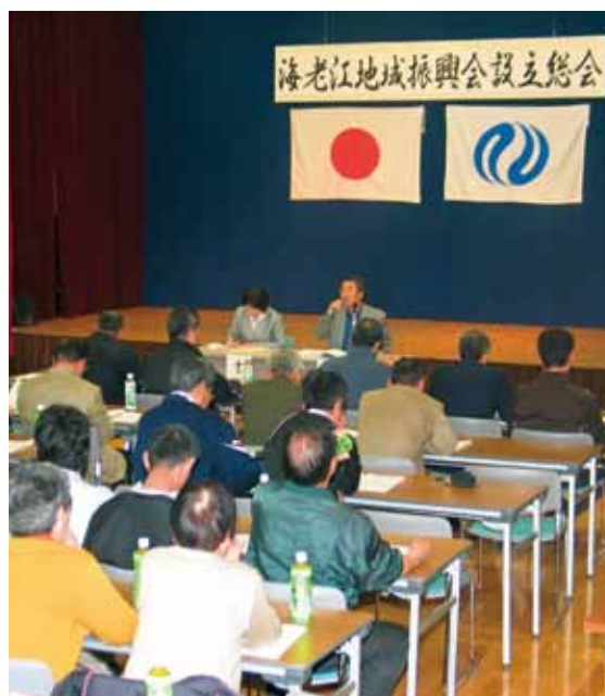
■地域振興会設立総会