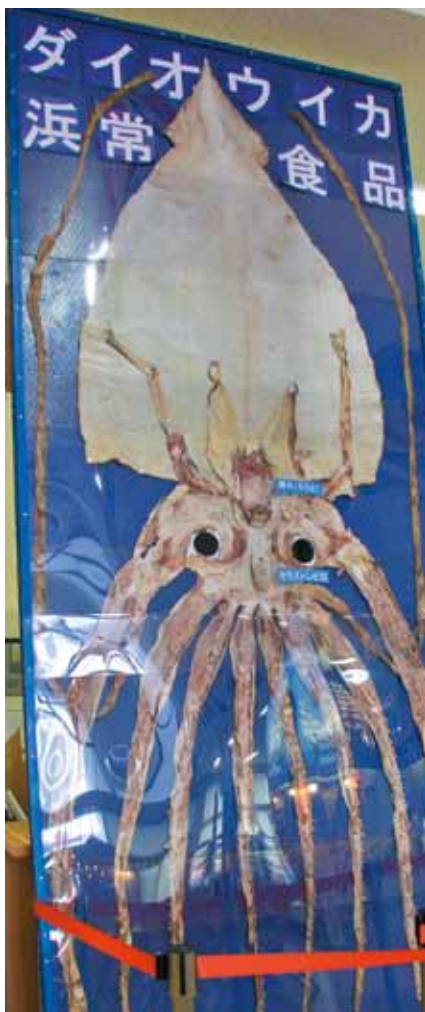
■ダイオウイカスルメ