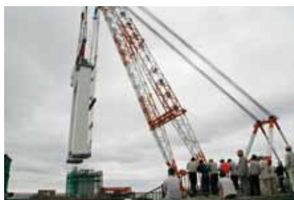
■新湊大橋主塔下部設置