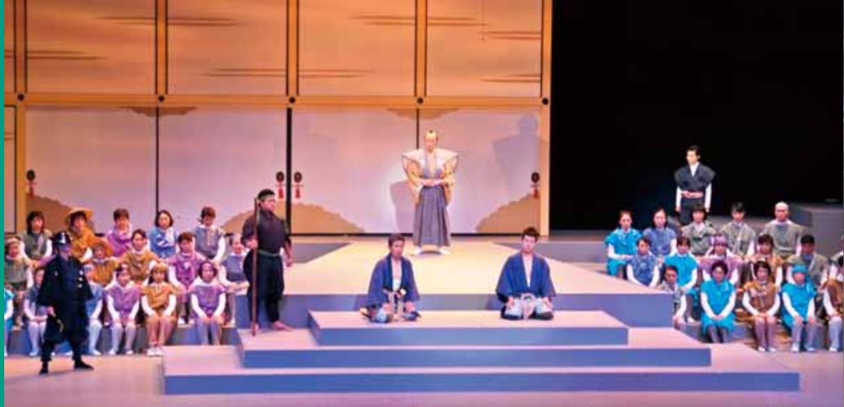
■射水市誕生5周年記念音楽劇「射水の海」