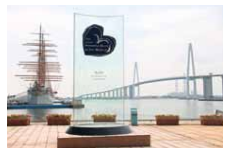
■「世界で最も美しい湾クラブ」加盟記念モニュメント