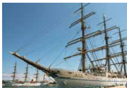
■二代目海王丸寄港