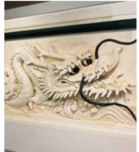
■日本最大級の鎧絵「双龍」