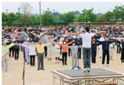
■特別巡回ラジオ体操・みんなの体操会