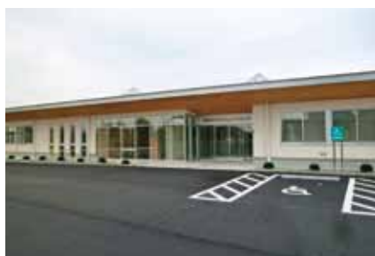
■片口コミュニティセンター竣工