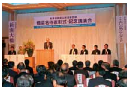
■「新湊大橋」名称決定