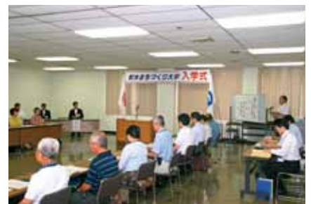
■射水まちづくり大学開学