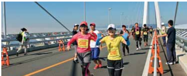
■新湊大橋をコースに海王丸ロードレース