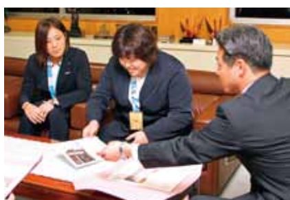
■田知本姉妹世界柔道団体で優勝