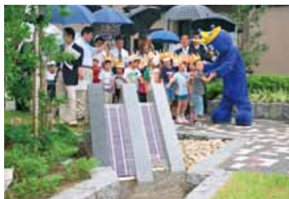
■小杉駅南せせらぎ水路完成式