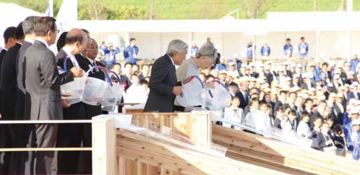
■第35回全国豊かな海づくり大会～富山大会～