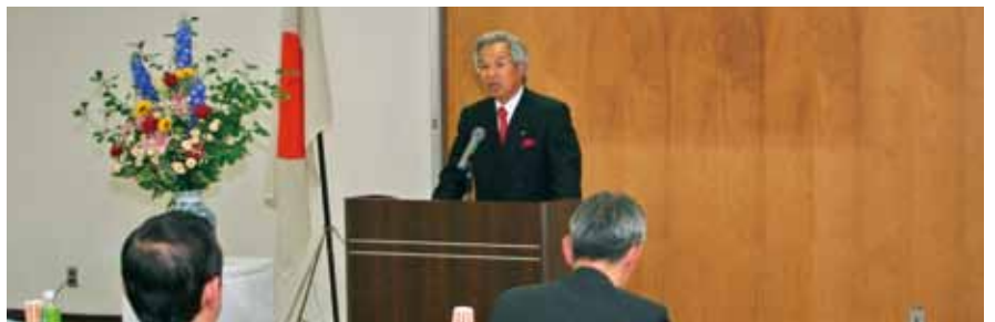
■自治会連合会設立