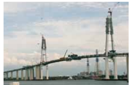
■新湊大橋中央部閉合