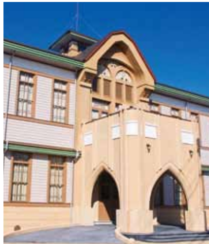
■リニューアルオープンした竹内源造記念館