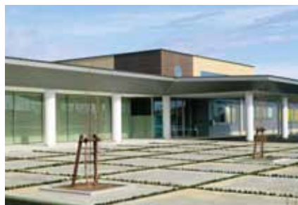
■太閤山コミュニティセンター竣工