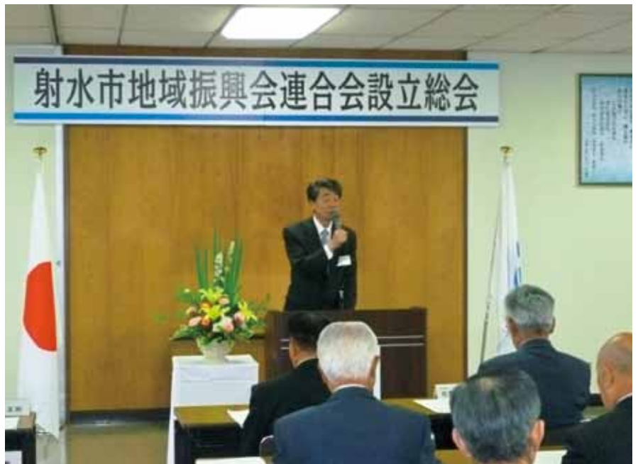
■地域振興会連合会設立