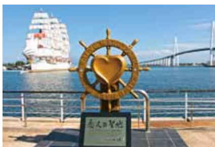
■恋人の聖地モニュメント