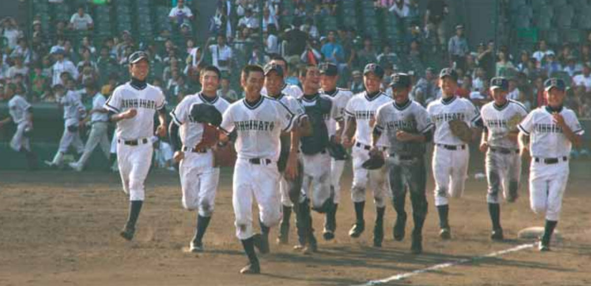
■新湊高校が夏の甲子園でベスト16