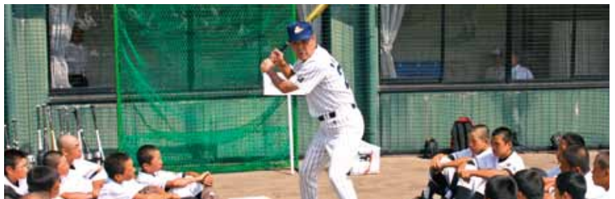
■ドリームベースボール