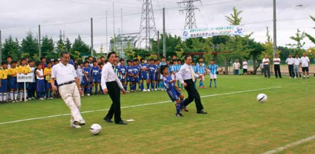
■薬勝寺池南公園サッカー場天然芝のグラウンド改修竣工式