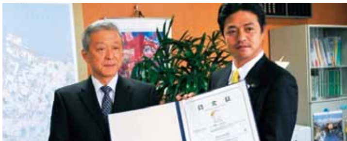
■射水市民病院 病院機能評価の新バージョン1を県内初認定