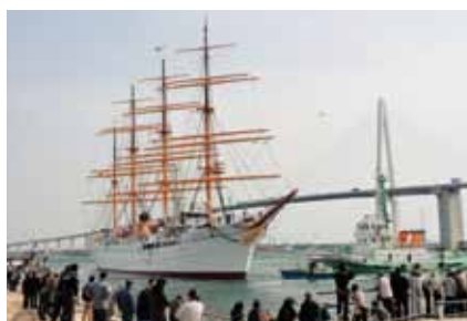
■海王丸が大規模修繕から帰港