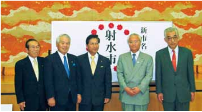
■新市の名称「射水市」に決定