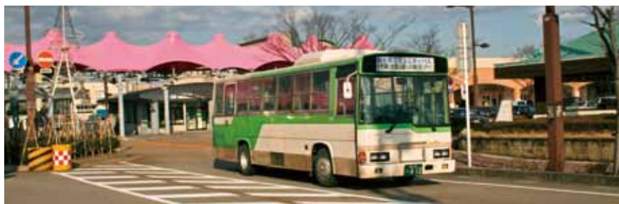
■コミュニティバス本格運行