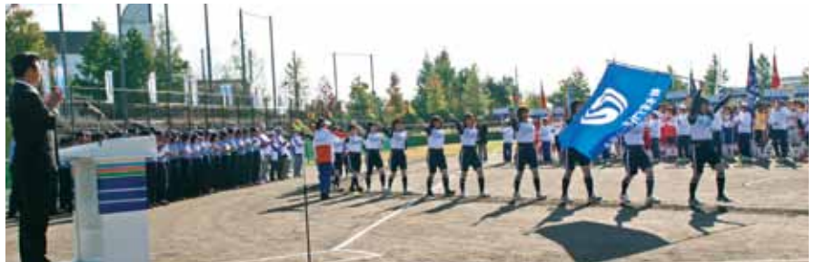
■全国スポーツ・レクリエーション祭 スポレクとやま2010