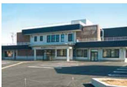
■庄西コミュニティセンター竣工