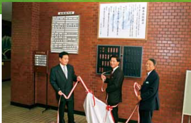
■射水市民憲章制定