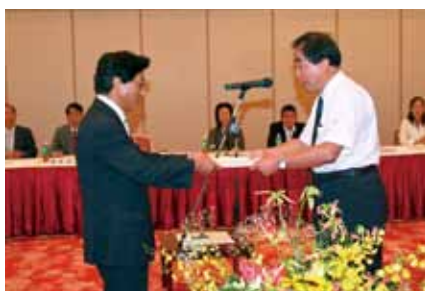
■「射水市総合計画 基本構想・基本計画」答申