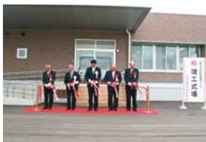
■学校給食センター竣工