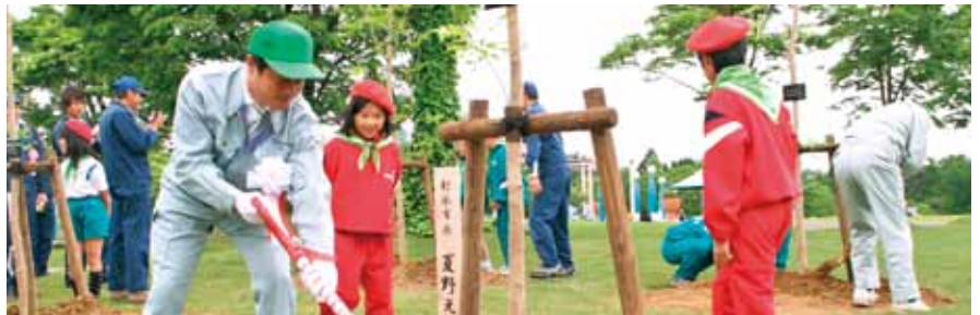
■第11回とやま森の祭典