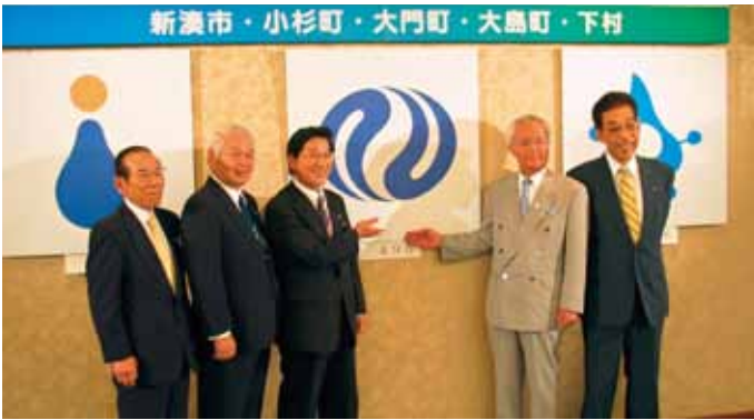
■射水市の市章の決定