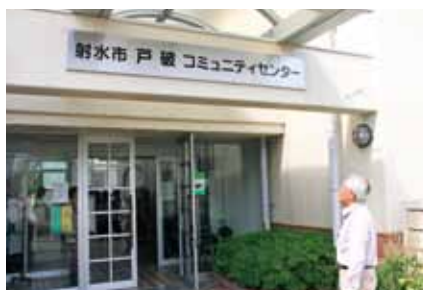
■公民館の名称が「コミュニティセンター」に変更