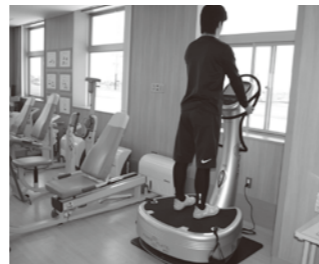
パワープレート®による筋力増強