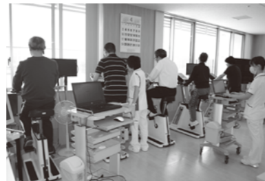
エアロバイクによる有酸素運動

運動には看護師や理学療法士が付き添い、心電図をモニターしながら安全にトレーニングを行うことができます。夜間心リハは保険診療ではなく、料金は1回2,000円です。詳しくは当院の地域連携室(電話82-8136)までお問い合わせください。