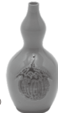
りよくゆうまどぬきひさごころり 緑釉窓貫瓢徳利

地方窯の雄として全国に知られる小杉焼。その開窯200年を記念し、市が購入した20点を含む優品約70点をご紹介します。艶やかな釉と洗練された優美な器形など小杉焼の魅力をどうぞお楽しみください。