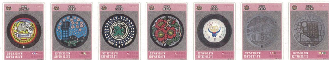
福岡県 北九州市 福岡県 志免町 佐賀県 江北町 熊本県 熊本市 熊本県 玉名市 大分県 佐伯市 沖縄県 中城村