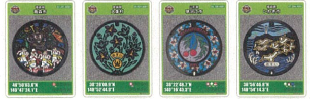
青森県 青森市 宮城県 大衡村 山形県 寒河江市 福島県 いわき市