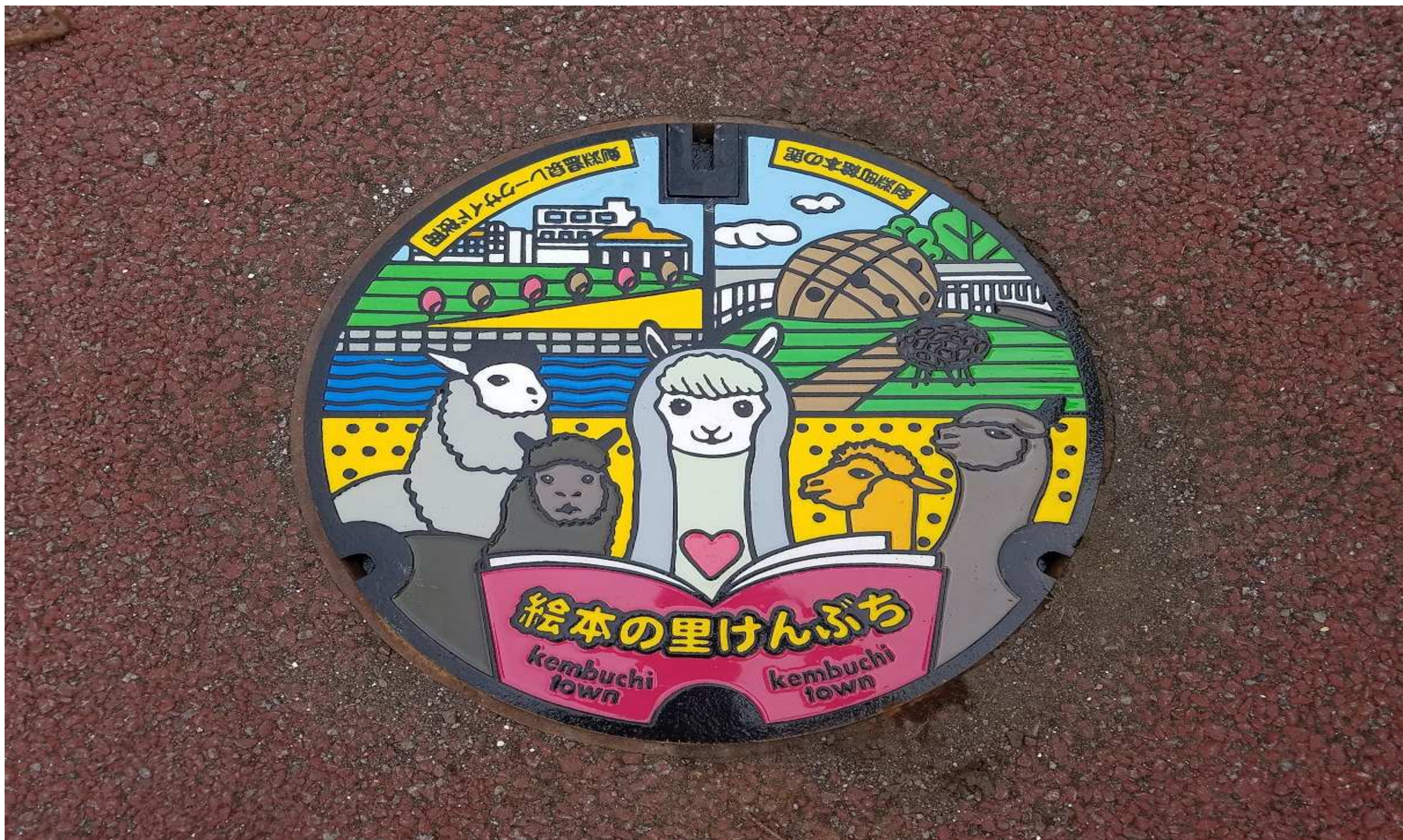
射水市姉妹都市 北海道剣淵町 下水道マンホール蓋