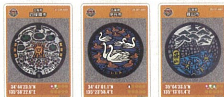
大阪府 四條畷市 兵庫県 伊丹市 兵庫県 篠山市 岡山県 瀬戸内市 岡山県 矢掛町 広島県 呉市 広島県 呉市 広島県 竹原市 高知県 流城下水道