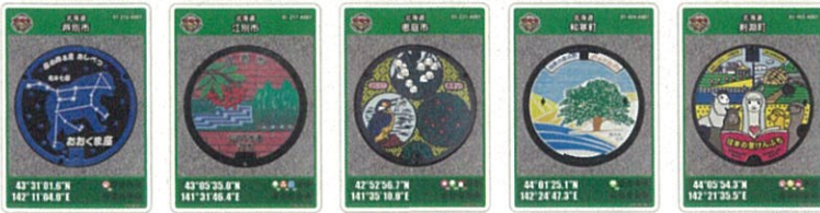
北海道 芦別市 北海道 江別市 北海道 恵庭市 北海道 和寒町 北海道 剣淵町