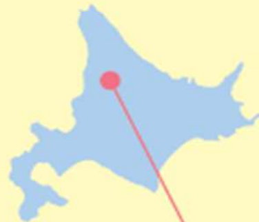
けんぶちちょう 剣淵町

面積：約 131km 2 人口：約 3,200人 名所：絵本の館、桜岡公園、 剣淵温泉他