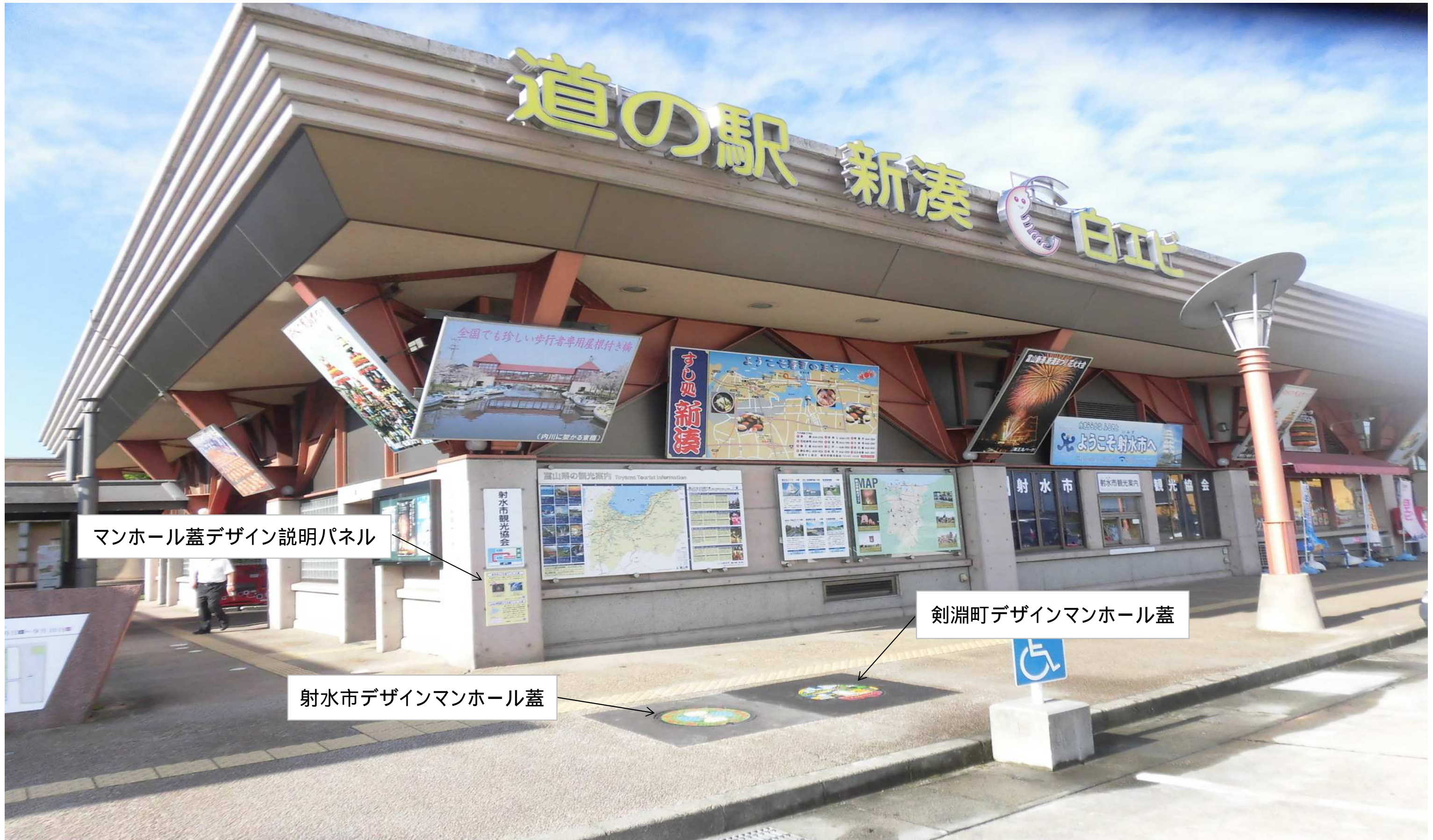
マンホール蓋デザイン説明パネル