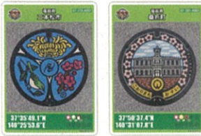
福島県 二本松町 福島県 桑折町 茨城県 鹿嶋市 群馬県 流城下水道 埼玉県 上尾市 埼玉県 吉川市 東京都 小倉井市