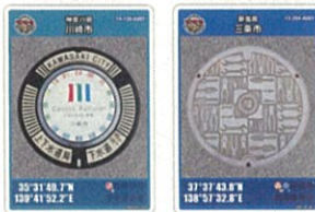
神奈川県 川崎市 新潟県 三条市 新潟県 村上市 富山県 射水市 長野県 飯山市 岐阜県 中津川市 岐阜県 郡上市 静岡県 沼津市 愛知県 稲沢市