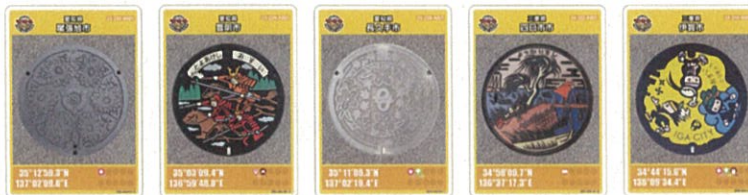
愛知県 尾張旭市 愛知県 豊明市 愛知県 長久手市 三重県 四日市市 三重県 伊賀市 滋賀県 大津市 大阪府 大阪市 大阪府 藤井寺市 大阪府 泉南市