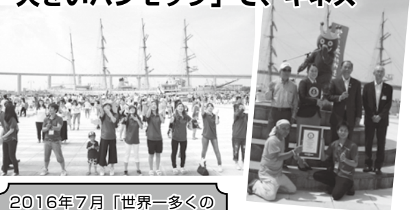
2016年7月「世界一多くの 人数で竹トンボを飛ばす」記 録でギネス世界記録達成