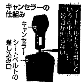
シートベルトのキャンセル

司法の場では、裁判官が判決を下す。裁判官は、法律に基づいて判決を下す。裁判官は、法律に基づいて判決を下す。裁判官は、法律に基づいて判決を下す。裁判官は、法律に基づいて判決を下す。