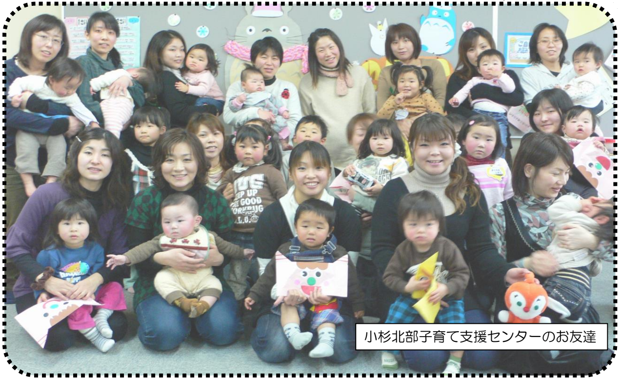
小杉北部子育て支援センターのお友達

「ちやいる.com どっとこむ いみず子育て情報」は、あなたの子育てのヒントになる情報をお知らせしたいとの思いを込めて発行しています。