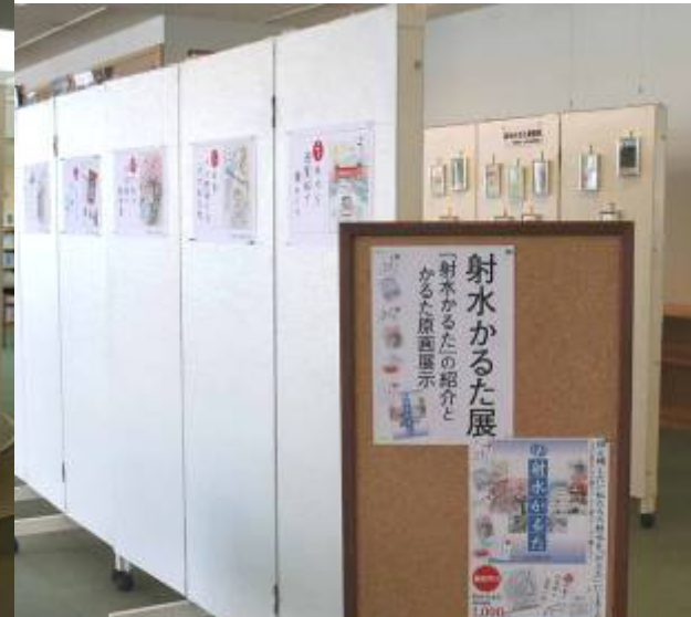
射水市中央図書館ミニギャラリー