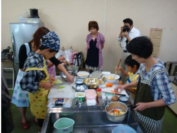
8チーム約20人が参加