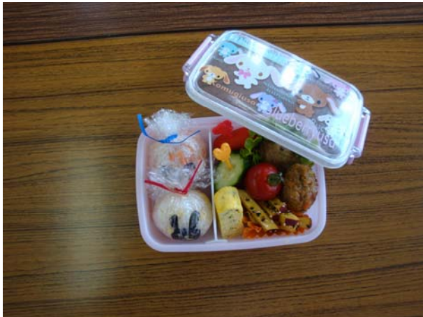
食べたくなるお弁当！！