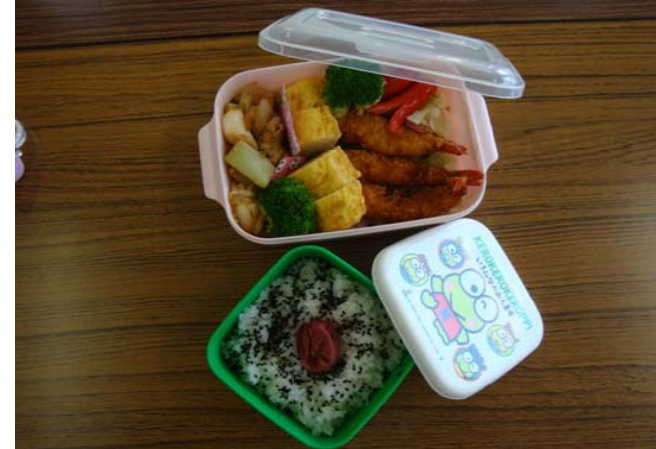
お父さん、仕事がんばってね弁当