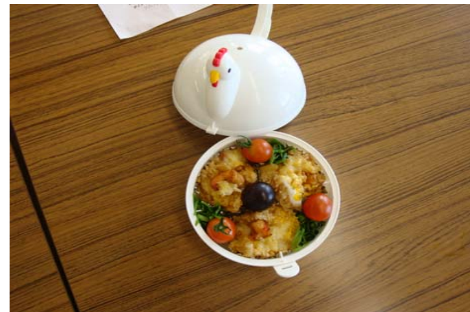
カレー大好きお弁当