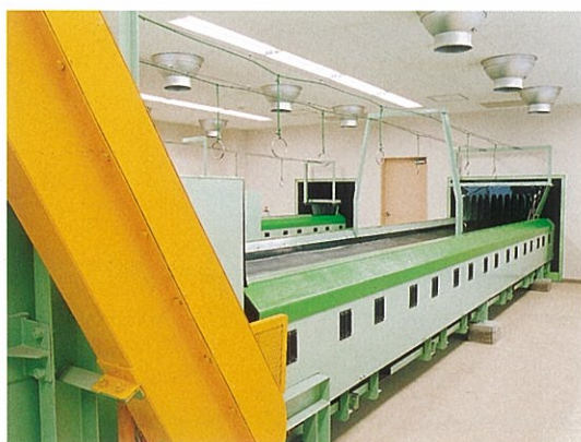
手選別コンベヤ 袋や不適物を除去します。