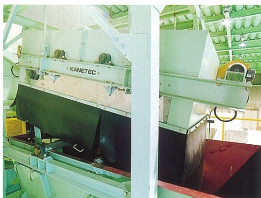
磁力選別装置 磁気力で鉄・アルミを選別します。