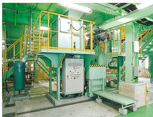
金属圧縮機 金属缶を圧縮し成型します。