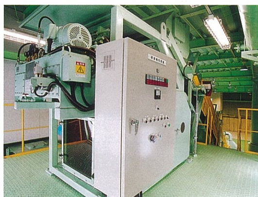
破袋機 袋を破ります。