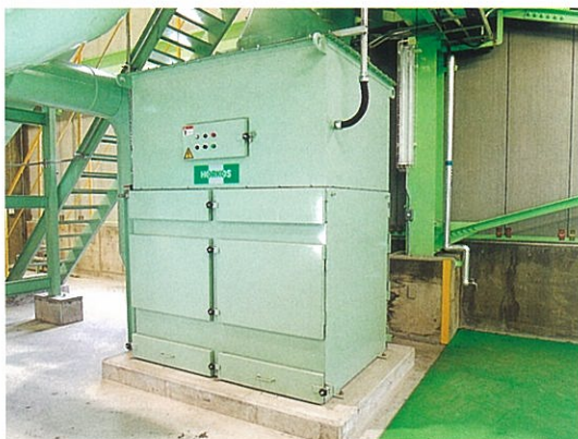
バグフィルタ 施設内に発生する粉じんを捕集します。