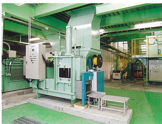
ペットボトル包装圧縮梱包機 ペットボトルを圧縮し梱包します。