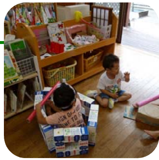
牛乳パックであそんでるよ→

Q: 幼稚園の預かり保育の利用はどのような理由で、どれくらい利用しているの？ A: 幼) 公立幼稚園の場合: 仕事や介護など、家庭で誰も見てくれる人がいないなどの理由で申し込まれます。本江・七美幼稚園では月10人程度、大門わかば幼稚園では1日20人程度が利用しています。 あおい幼稚園の場合: 第2・第3幼稚園とも幼稚園預かり保育を実施しています。利用者は共働き世帯が多いです。長期休暇時には毎日園児の1/4程度が預かり保育にきています。