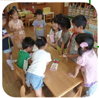
先生と楽しくお話→