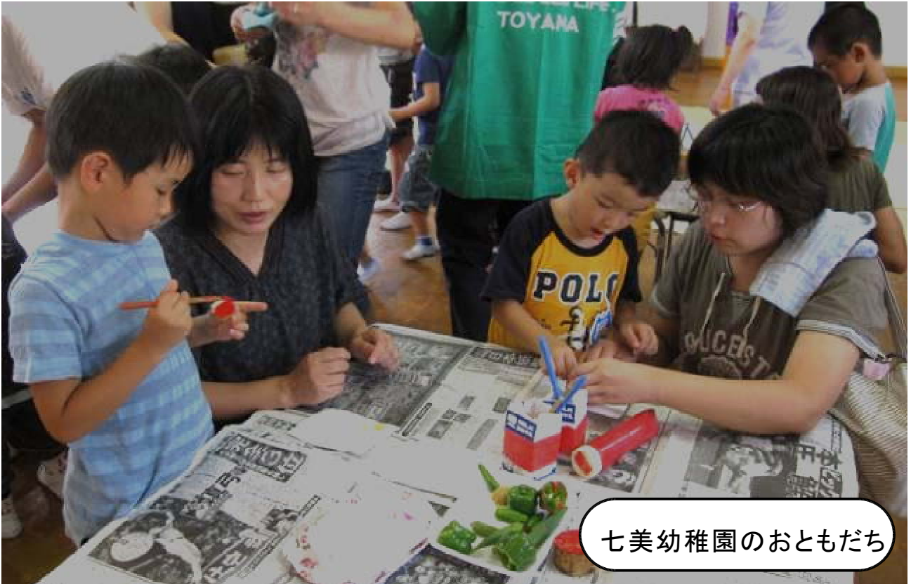
七美幼稚園のおともだち

「いみず子育て情報 ちやいる.com(どっとこむ)」は、射水市で子育てしているパパ・ママのための子育て情報をお届けしています。情報誌では、射水市民の方がもっと知りたいと思う情報について、少子化対策調査研究ワーク委員の方々と一緒に調べ、情報を提供していきます。