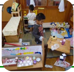
楽しくおままごと遊び→

Q: 母親が途中で失業したり、妊娠した場合、子どもは保育園に通えないの？ A: 保) 家庭で保育することができる状態であれば家庭で保育をしていただくことが原則です。ただし、求職中の場合や出産前後(出産前2か月、出産後3か月、合計5か月)は入園することができます。