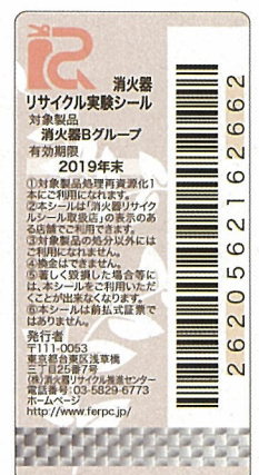
社会実験用消火器 リサイクルシール 有効期限 10年 (2010年製造分のみ)