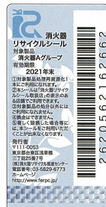
新製品用消火器 リサイクルシール 有効期限 10年