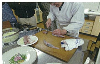
《さすが！見事な手さばき》

参加者 10 名が、慣れぬ手つきで先生の手を借りながら、全員美味しそうな？お刺身が出来上がりました。