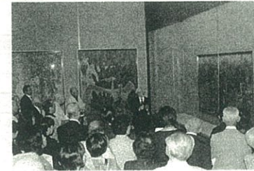
*新湊博物館での企画展作品解説