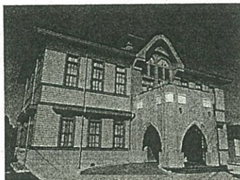
*竹内源造記念館：国登録有形文化財