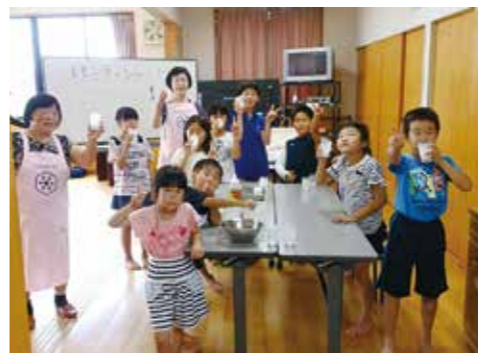
勉強の後のおやつ作り

※自薦、他薦は問いません。このコーナーに登場していただき、ご連絡をお待ちしています。未だ創造課 ☎51-66614