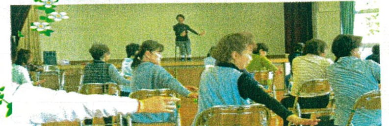
ゆめ体操の参加者の皆さん (この日は椅子を使った体操を行いました!)