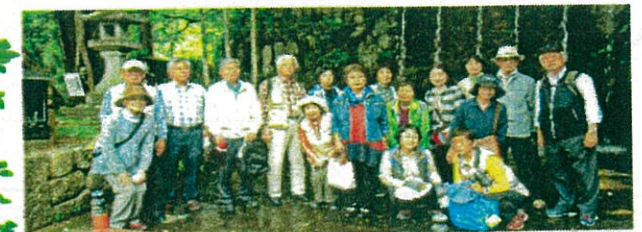
5月9日(木) 名水探訪の参加者の皆さん