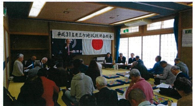
三ヶコミュニティセンター2F和室