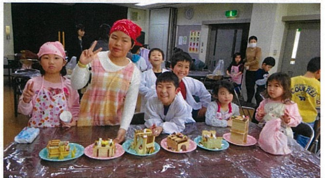
三ヶコミュニティセンター視聴覚室