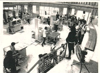
ガラス工房体験教室