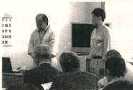
射水市総務課 防災危機管理班

活動計画発表終了後、射水市総務課防災班の方を講師にお迎えして、「災害に備えて」と題して、講演をいただきました。