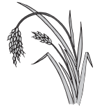
平成31年分～平成33年分の農作業標準料金・賃金