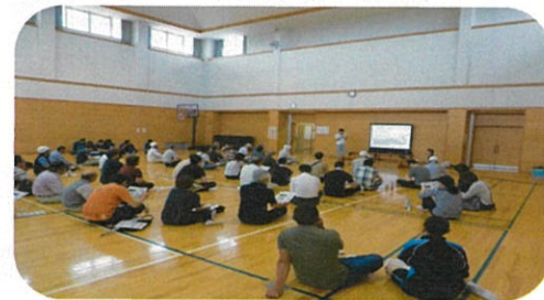
《「災害に備えて」出前講座》