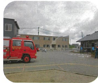
《分団による放水訓練》

これらの訓練・研修は、射水消防署、射水市役所の指導協力を得て橋下条分団及び地域主体で実施しました。