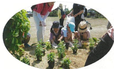
《上手に植えたかなあ～》