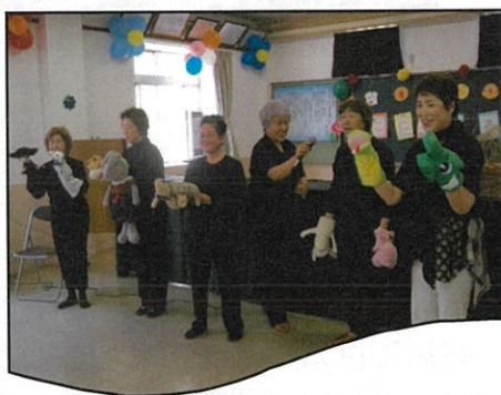
《太陽グループスタッフの方々》

7月19日(金) 参加者37名 いろりの里 会員の交流会 「太陽グループ」による楽しい人形観劇会が披露されました。