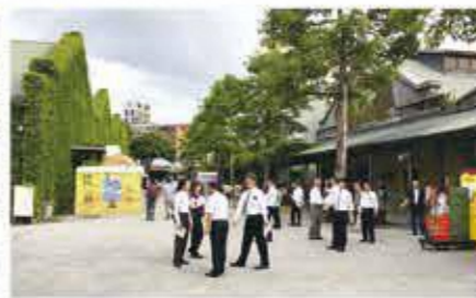
華山文創園區 日本統治時代から1987年の移転まで、酒の醸造所があった大規模な工場跡を改装したスペースです。現在はショップやカフェなどにリノベーションされました。