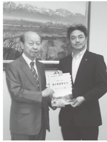
石井知事に要望書を渡す夏野市長