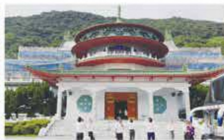
陽明山中山楼 孫文の生誕100年を記念して1966年に建設。かつては国人大会(国会にあたるもの)や国賓をもてなす特別な場として活用されていた歴史建築物です。