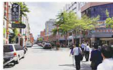
迪化街 漢方薬などの問屋が建ち並ぶ古い街並みで、近年はリノベーションが進み、おしゃれなショップが点在する地域です。