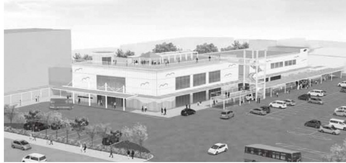
※複合交流施設の外觀イメージ