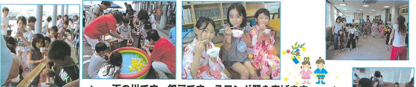
♪……天の川です 銀河です スワンが翼を広げます……♪

今年も“檜田ふれあい七夕まつり”を開催しました。民生児童委員・子育て支援の皆さんによる七夕の“スライド”を静かにみて、太田先生とのコーナーでは、からだを動かして子どもたちは元気いっぱい。“つまんこ”・“ヨーヨーつり”に“うちわ作り”。“流しそうめん”では、トマトやキュウリ・ミカンなども流れてきて大喜び。流しそうめんは楽しかったようです。