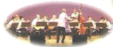
マンドリン演奏 《カンティナの皆さん》