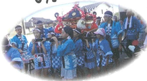
《 こどもみこし 》