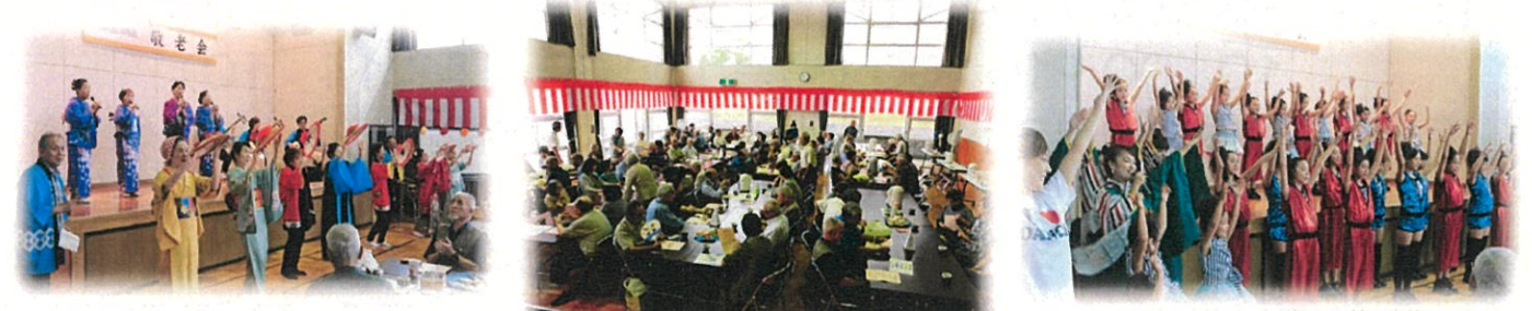
射水正声民謡会の皆さん

◆9月16日(月・祝日) 南太閤山地区の敬老会が南太閤山コミュニティセンターで開催され、ご招待者425名のうち103名が参加されました。式典は高島地域振興会長から皆様へ祝辞があり、米寿を迎えられ出席された3名の方(南太閤山で15名)に、県知事と市長から祝いの賞状が贈呈されました。その後、第3あおい幼稚園、いちごくらぶ、射水正声民謡会の皆さんの「唄や踊り」で敬老会を楽しみました。