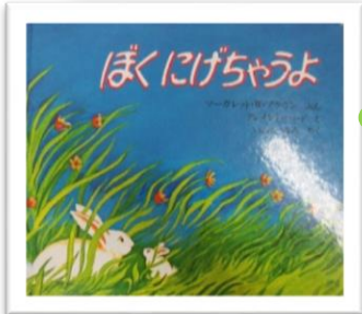
『ぼくにげちゃうよ』 作 マーガレット・ワイズ・ブラウン 絵 クレメント・ハード 文 岩田 みみ

一冊目は大型絵本「あかまるちゃんとくろまるちゃん」穴が開いている仕掛け絵本! いろいろなものに変身していく様子がおもしろい♪