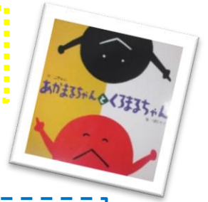
『あかまるちゃんとくろまるちゃん』 作 上野 与志 絵 村松 カツ