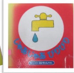
『じゃあじゃあぶじごころ』 作 絵 まついのりこ