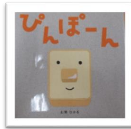
『ピンぽん』 作・絵 山岡ひかる