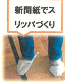
新聞紙でスリッパづくり