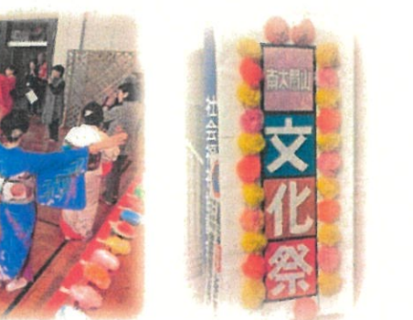
文化室 地域住民の作品展示