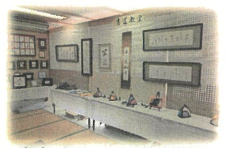
和室 各サークルの作品展示