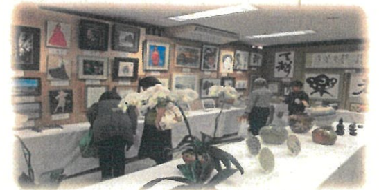
会議室 保育園・幼稚園・小学生の科学作品などの作品展示