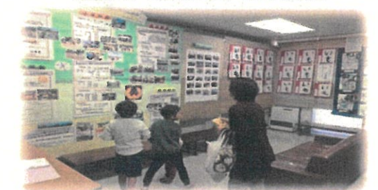
会議室 保育園・幼稚園・小学生の科学作品などの作品展示