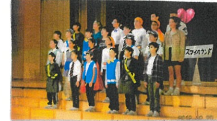
10/20 小学校学習発表会