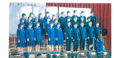
10/26 中学校文化活動発表会