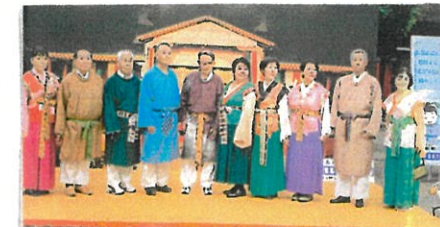
10/5 高岡万葉集朗唱の会出場