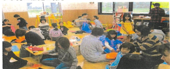
ハロウィンの衣装を親子で手作り