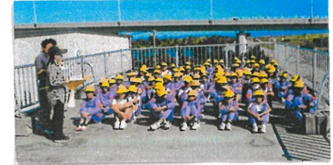
10/9 地震・津波対応避難訓練