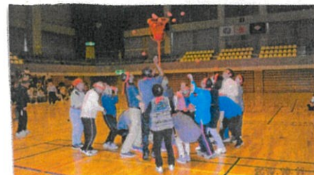
10/11 新湊地区老連スポーツ大会