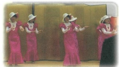
戸破の方も参加しているフラグループ

住民にはより便利な施設になりました。当日の落成式にはテープカットに続き、市長他の挨拶があり、フラダンスや幼稚園児のアトラクションが披露されました。3Fには「青空ひろば」も設置され、戸破、三ヶ地域振興会が中心の「まちづくり協議会」での各種イベントにも有効活用できるのではと期待が膨らみます。