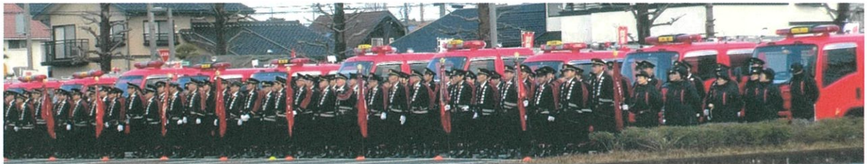
射水市消防出初式