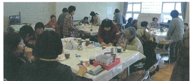
(2月18日 折り紙でお雛様作りの様子)

100歳体操は日常的に必要な筋肉をアップさせる介護予防です。続ける事で少しずつ身についていきます。体操の後は、レクリエーションをしたり、脳トレをしたり、おしゃべりをしながらおやつを食べたり…楽しい時間を一緒に過ごしましょう！お待ちしております。