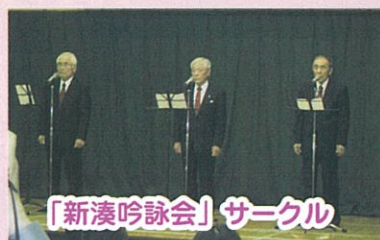
「新湊吟詠会」サークル