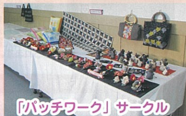
「パッチワーク」サークル