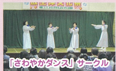
「さわやかダンス」サークル