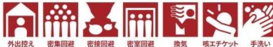
外出控え 密集回避 密接回避 密室回避 換気 咳エチケット 手洗い