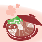
氷見牛ロースすき焼き肉 2名様