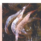
しろえび刺身 2名様