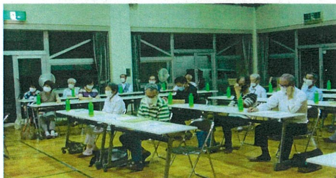
参加された福祉委員・民生児童委員のみなさん

講演「地域の高齢者を支えていくために」 小杉南地域包括支援センターによる介護予防 ケアマネジメント・介護保険制度についての講 演がありました。