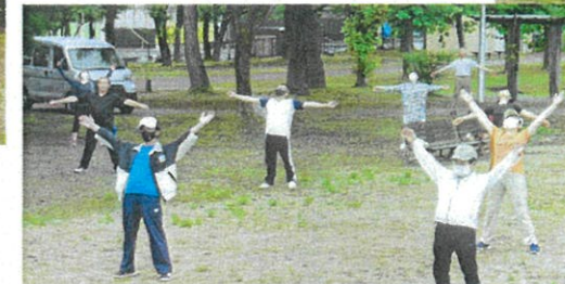
小雨の中、ラジオ体操を楽しむ方々