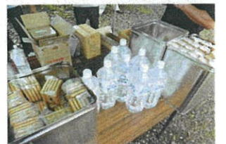
ラジオ体操会の準備