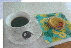
コーヒーとタルト

◆南太閤山の高齢者の皆さんに元気になって頂くため、毎週火曜日13:30~開催しています。・・・皆さん！来てネ♡