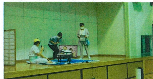
寸劇をする講演部の皆さん