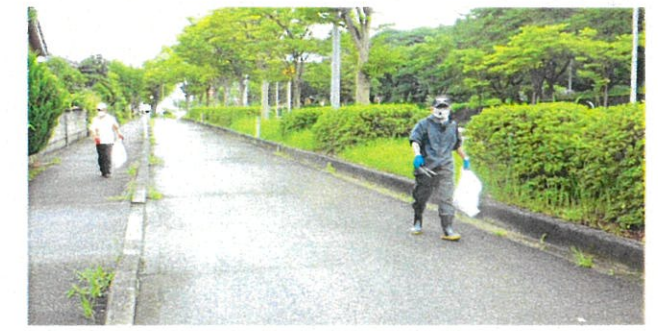
七美線道路沿いのごみ拾い