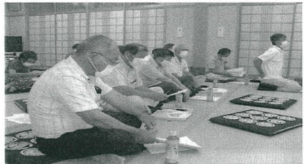
8月8日（土）大江コミュニティセンターにて説明会