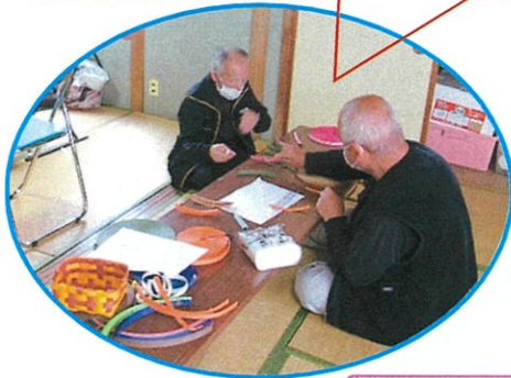
大きな七夕作ったよ♡