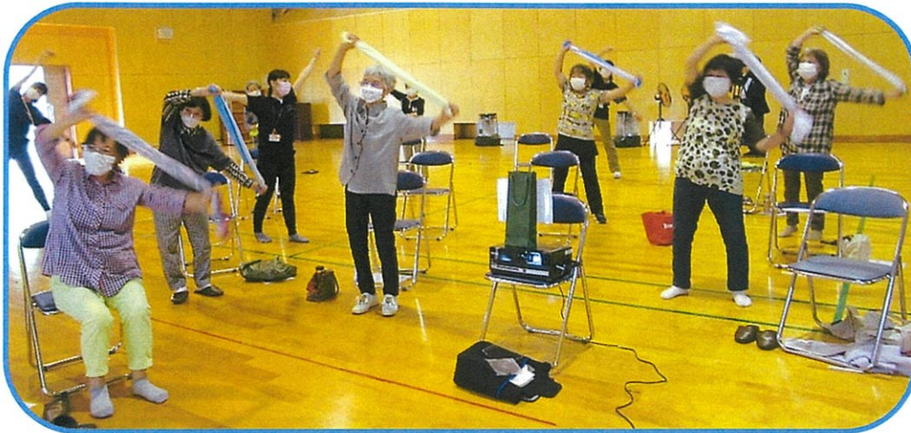
♪タオル体操（365歩のマーチに合わせて）♪