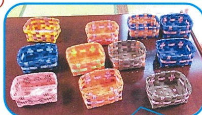
すてきなかごになったね