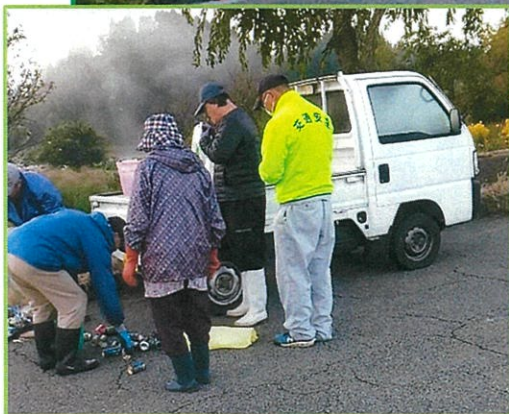
《青井谷：県道 377 号線両側》