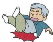
《こんなところで事故になるんだね》

用排水路転落事故防止の研修会の後、専用ペンを使いカラースクラッチカードにお絵描きをして、お楽しみ会をし、昼食会を開催しました。久しぶりに集まり賑やかな会になりました。