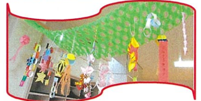
☆ 願いを込めた七夕飾り ☆