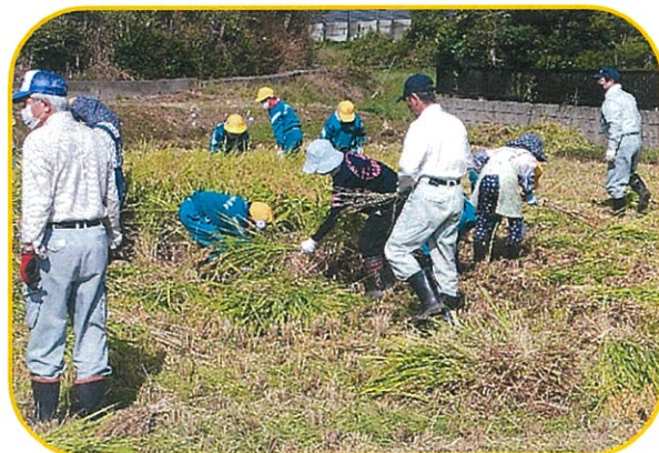
《中々いい手つきしてるねえー》

金山小学校5,6年生、田んぼの先生、学校田運営委員会の皆さん等、総勢40名余りで「新大正もち」の稲刈りが行われました。子供たちは、一株が大人の手でも握れないほど大きく育った稲を刈って、教わった通りに一生懸命に束ねていました。学校田に関わった皆さんのお陰様で、今年は571.8kg(昨年比34.4kg増)も収穫ができました。