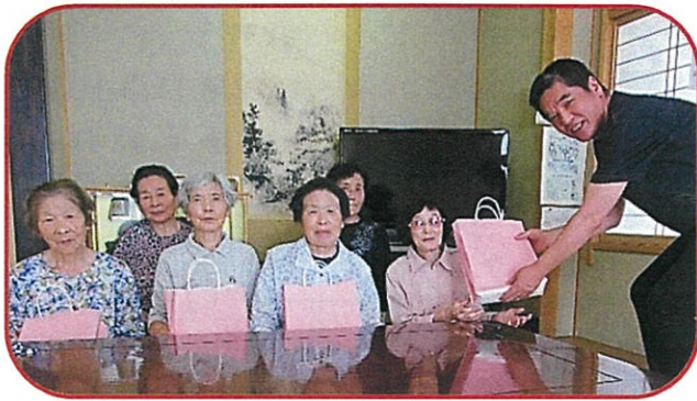
《上野地区の皆さんに記念品を手渡し》

コロナ感染症の影響で敬老会が開催中止となったため、全ての対象者 213 名の皆さんに長寿と健康を祝い記念品を贈りました。