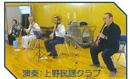
演奏：上野民謡クラブ