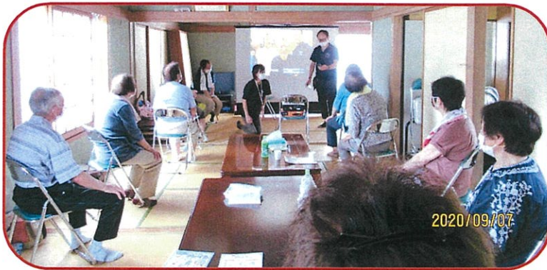
100歳体操+講習会 タオルもこれから使います