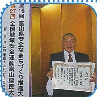
第16回 富山県安全なまちづくり推進大会 第27回 全国地域安全運動富山県民大会 富山県警察本部(公財)富山県防犯協会