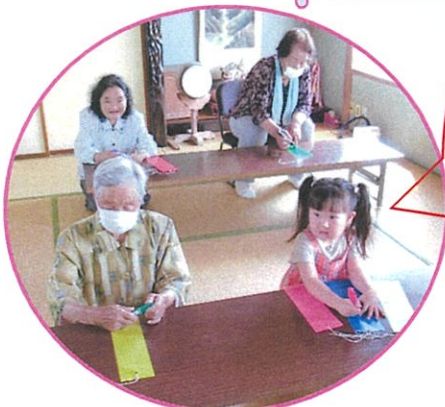
願い事をしたためて