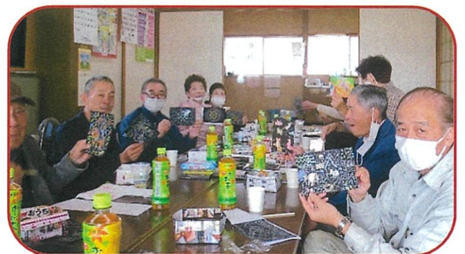
《みんなで作品を見せ合いっこ》