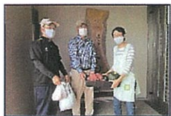
ふれあいホーム小泉

今年も、昨年同様“櫛田ふれあいファーム”でとれたサツマイモ・冬瓜・カボチャ等を、小泉の『ふれあいホーム小泉』の皆さんにも食べて頂こうと持っていきました。また、牧田の『COCORO(児童発達支援所)』にもサツマイモ・飾りカボチャ等を届けたところ後日、子どもたちから「美味しかったよ。」とお礼のカードが届きました。