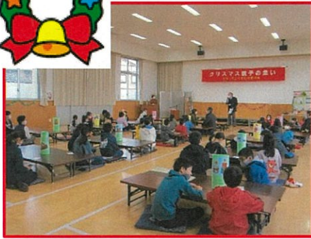
文化スポーツ部長挨拶