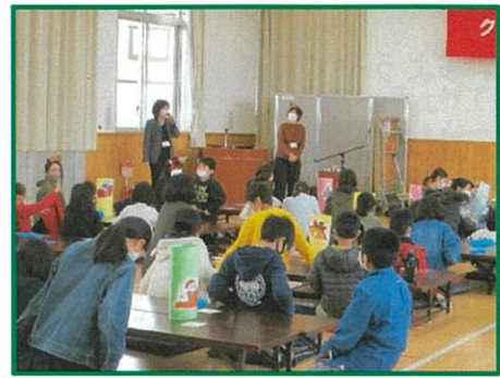
挨拶とルールの説明

頭を使った何種類もの ボードゲームを教わり、 子供たちは真剣に、楽し く過ごしました。