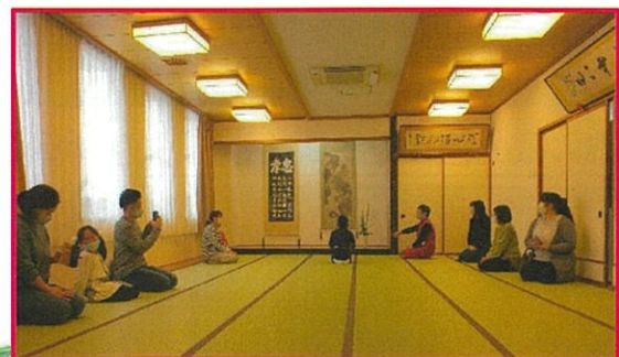
席入りの練習です