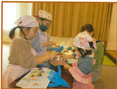
パパへ、楽しみにしてね