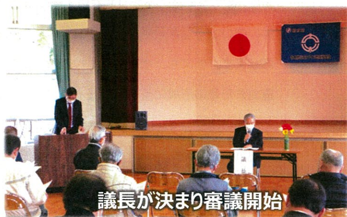
議長が決まり審議開始

昨年度は、新型コロナウイルスの影響で各種会合、行事が延期、中止となり、また、今年1月1日に予定しておりました太閤山ランドでの左義長も35年ぶりの大雪で中止となりました。当振興会は、高齢者が住み