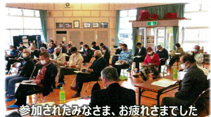
参加されたみなさま、お疲れさまでした

地域支え合いネットワーク事業は、昨年歌声喫茶は中止となりましたが、百歳体操は、一時期中断したものの1回あたりの参加者を減らし回数を増やすなどして、新型コロナウイルス感染症予防対策を行った上で、パスコ及び日の宮集会所で行うことができました。今年度は、同事業が