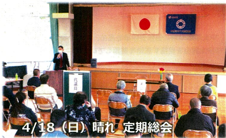
4/18 (日) 晴れ 定期総会

新芽の緑が鮮やかに照り映えることとなりました。皆様、いかがお過ごしでしょうか。日頃は、まちづくり地域振興会の運営に多大のご協力を頂き厚く御礼申し上げます。