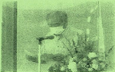
高野高齢者学級長

5月15日（土）13時30分から、大江コミュニティセンターにおいて、令和3年度生涯学習活動事業の各学級合同開講式が行われました。宮崎地域振興会長が開講の挨拶、不後市議会議員の祝辞に続き、各学級長さんから今年度の活動計画の説明がありました。