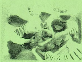
大江保育園児も保育園で植え込み