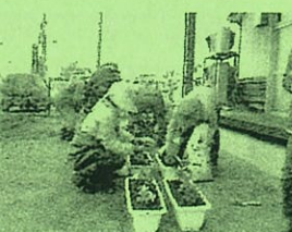
プランター植え込み