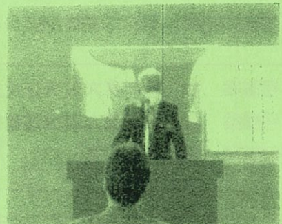
不後市議会議員の祝辞