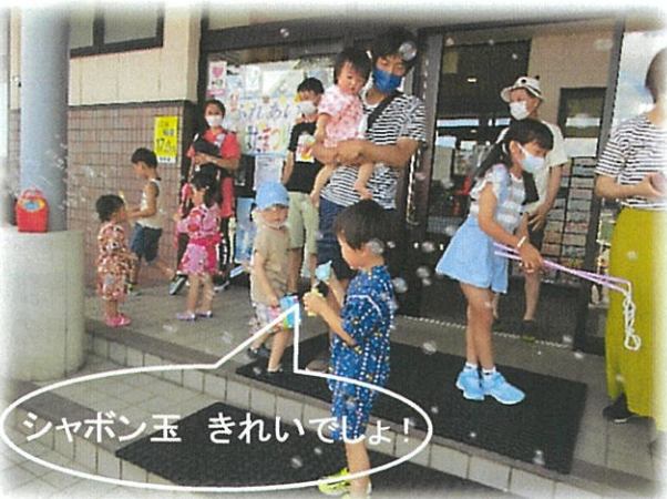
シャボン玉 きれいでしょ!

8月1日(日)“櫛田ふれあい七夕まつり”が行われました。射水消防署からやってきたのは、“はしご車”です。グリーンと空に伸びた長〜いはしごは31m。「スゴイネ・・・」と初めて見る“はしご車”に小さな子供たちは、驚きいっぱいでした。