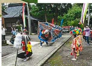
三ヶ錦町獅子舞保存会