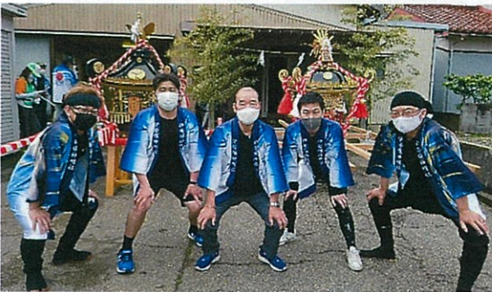
【川腰会長・永森県議 他で集合写真】

そこで、『40代が中心となり子供たちがワクワクする事に挑戦する』事を理念としている三ヶ未来創造部会として応援する事にしました。