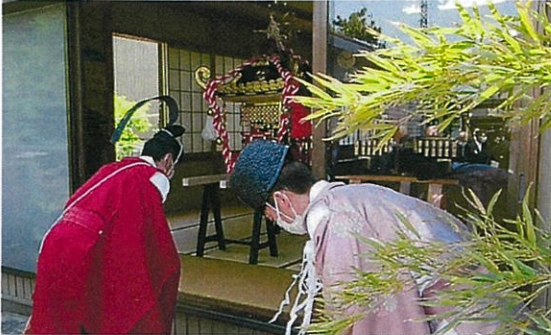
【開催の成功を祈願する宮城宮司】

去る5月16日(日)に伊勢領地区で開催された「伊勢領みこし祭」に三ヶ未来創造部会から協力しましたのでご報告します。