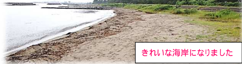
きれいな海岸になりました

今年も小雨・コロナ禍での開催となりましたが、多くの参加がありました。富山県内の海岸漂着物の8割は、内陸部から水路や河川を通じて海に流れ出した物であると考えられています。日頃から気をつけたいですね。 ご苦労様でした。