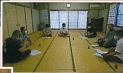
← 実行委員メンバーで思い出の記念撮影