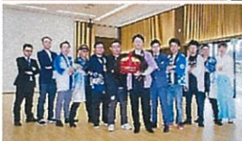
三ヶチーム → で記念撮影 (十社の宮)