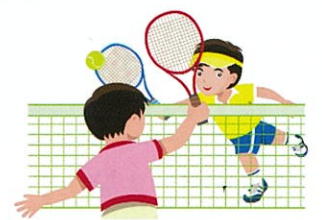
フレッシュテニス体験練習風景