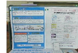
ヘルスポランティア