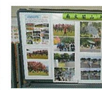
地域振興会活動報告