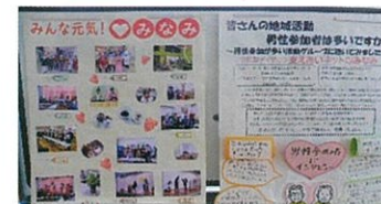
支えあいネット♡みなみ