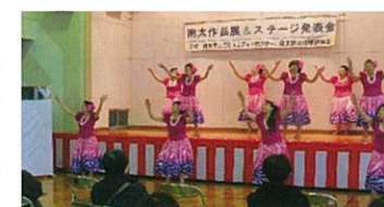
Q'sフラクラブ(フラダンス)