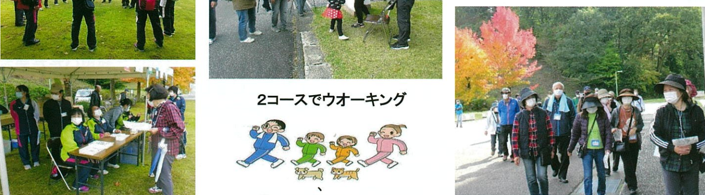
2コースでウォーキング