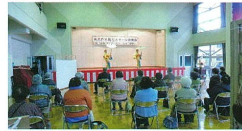
なでしこ教室(民踊)