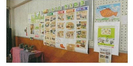
令和3年度コミセンレポート