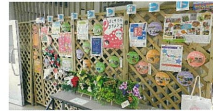
令和2年度コミセンレポート

作品展：11月21日(日)・22日(月)、ステージ発表：11月23日(火・祝) コロナ禍で文化祭が中止になる中、なんとか活動発表ができないものかと、3日間をかけて、作品展&ステージ発表を、規模を縮小してコミセンのサークルさんのみで開催しました。ステージ発表については、フラダンス、日本舞踊、剣詩舞、民踊のサークルさんに、一部、二部で二回の発表をお願いしました。作品展は、パソコン作品、書道、篆刻、絵手紙の4サークルさん。♡みなみ、長寿会、ヘルスポランティア、地域振興会、コミュニティセンターには、活動報告を展示してもらいました。ワークショップあり、クラフト市あり、顔出しパネルありで楽しい3日間になりました。