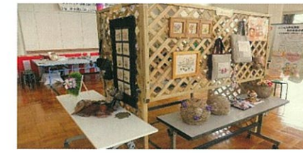
コミセン生涯学習作品