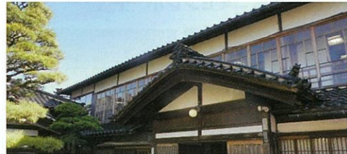
豪農屋敷 「清八楼」 見学・食事