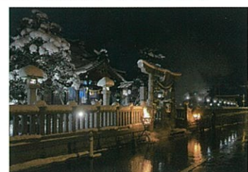
かがり火が美しい年明けの大門神社

https://daimon-chiiki.seesaa.net/ 「大門地域振興会のブログ」