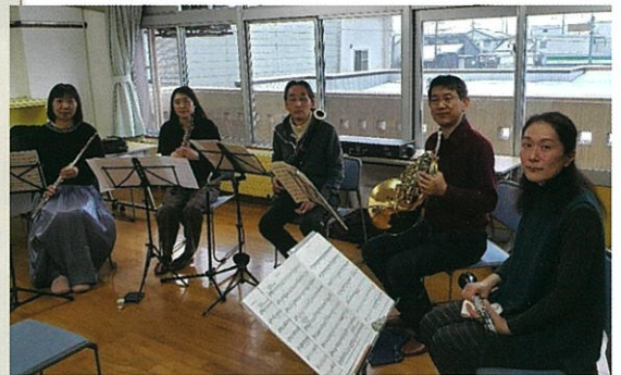
活動中の「アンサンブル ポワール」のみなさん