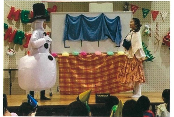
劇団からくり玉手箱 (演劇)