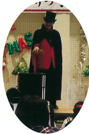
シンキロウ (コメディマジック)