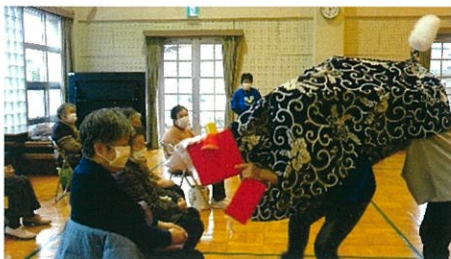
2/10 節分 邪気払い獅子舞

毎週火曜日：戸破コミュニティセンター 13：30～ 100歳体操 14：20～ カフェオープン 参加費：200円（申込み不要！）