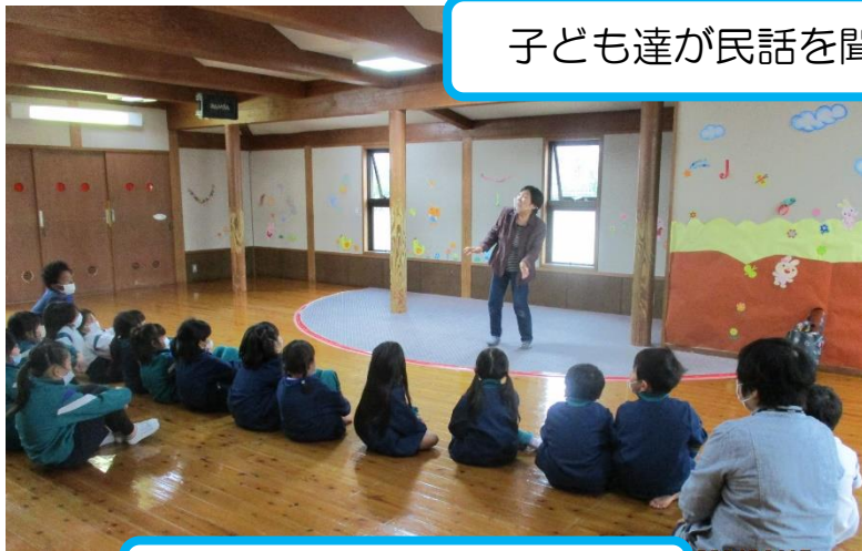
子ども達が民話を聞いている様子

・今年度最初のお話の日。 1年生全員とお話を聞きたい子が参加しました。 素話なので、はじめは戸惑っている子もいましたが、講師の先生の話し方にひきこまれ、静かに聞いていました。