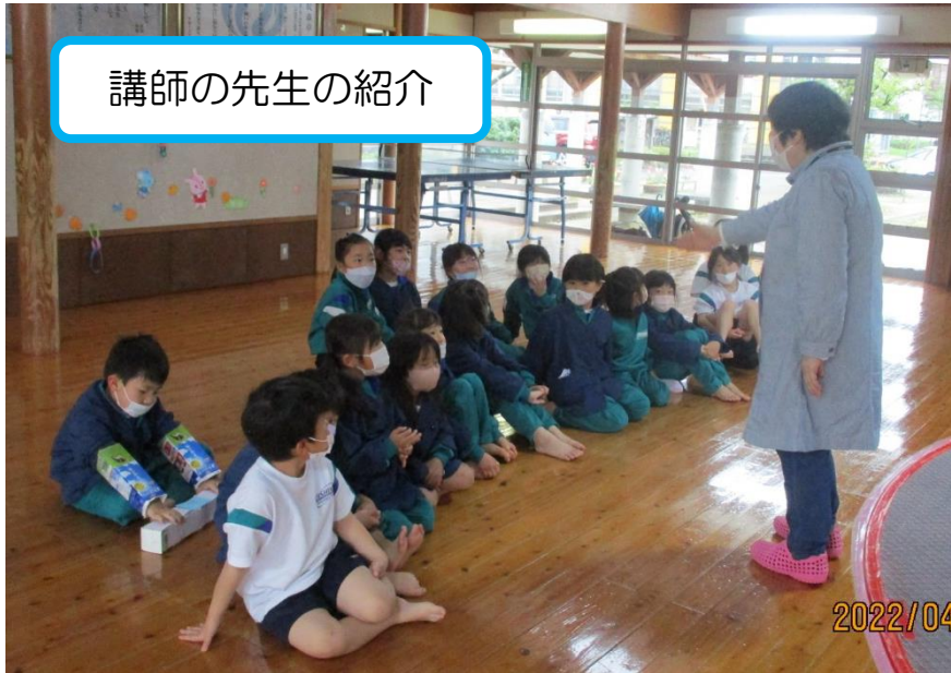
講師の先生の紹介